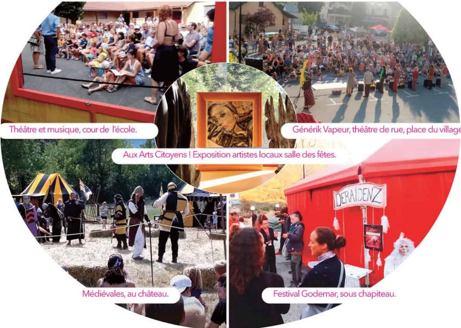
Théâtre et musique, cour de l'école.

« Estivalemment vôtre ! » La culture en fête cet été 2022 à Saint-Firmin.